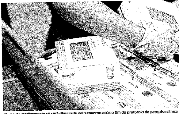
Nome do medicamento só será divulgado pelo governo após o fim do protocolo de pesquisa clínica

O ministro destacou a importância e o trabalho da ciência brasileira na busca por soluções contra a pandemia da Covid-19. "Nós estamos falando de ciência feita no Brasil, uma ciência respeitada em todo o mundo. Os nossos cientistas são muito responsáveis, não só pelo conhecimento, mas pela ati-