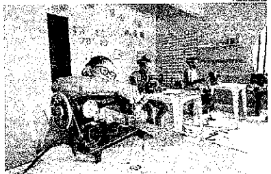
Mulheres da Vila Maranhão aprenderam a reciclar lona em bolsos