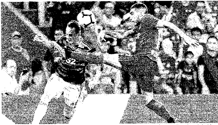
Flamengo volta a jogar mal e perde para o Emelec por 2 x 0, em Guayaquil, pelas semifinais da Copa Libertadores da América