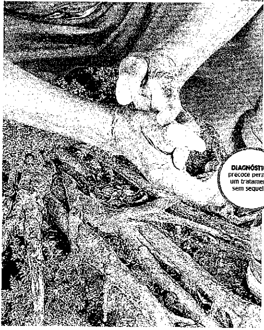
DIAGNÓSTICO precoce permite um tratamento sem sequelas